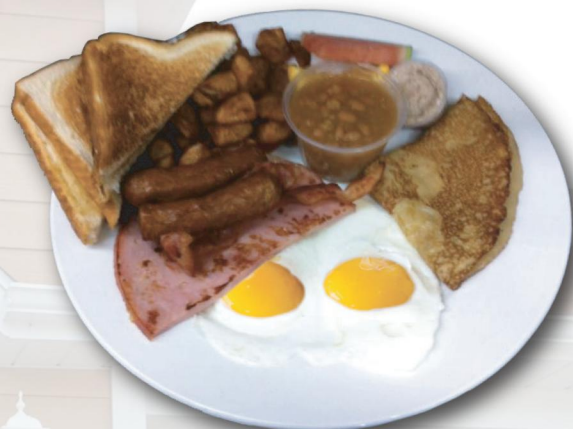
Déjeuner du chef

POUTINE DÉJEUNER 16.50 $ (patates, fromage en grain, oeuf, sauce Hollandaise, bacon, jambon, saucisses, piments, champignons et oignons)