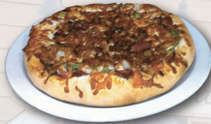
Spécial du chef