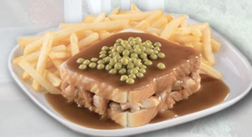
Sandwich au poulet chaud