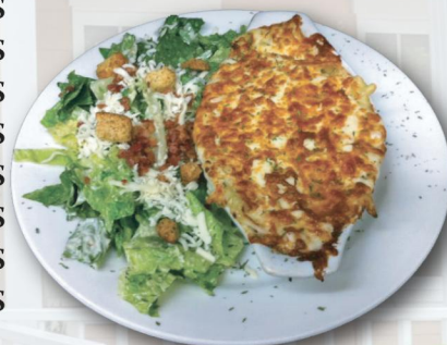
Lasagne salade César