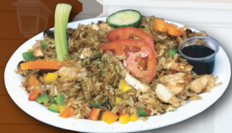
Riz au poulet