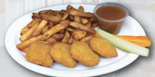
Croquettes et frites

* Tout le personnel du Restaurant des 3 étoiles*** vous remercie de votre visite...au plaisir de vous revoir !