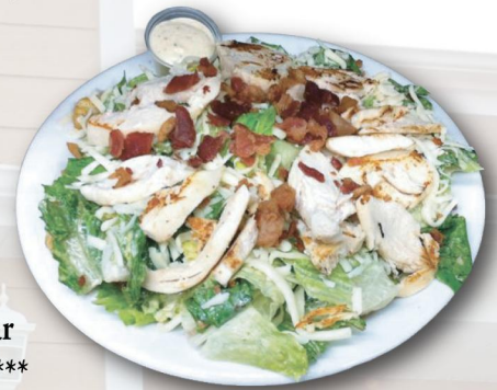
Salade César poulet grillé***