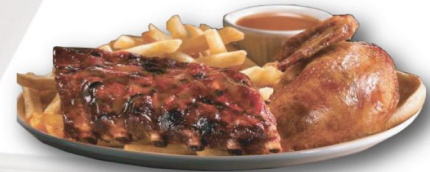
Demi côtes levées et poitrine