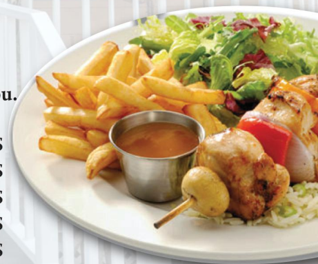
Brochette de poulet et salade César

Les brochettes sont servies avec riz, frites ou patates grecques, salade césar et sauce au poivre ou sauce barbecue.